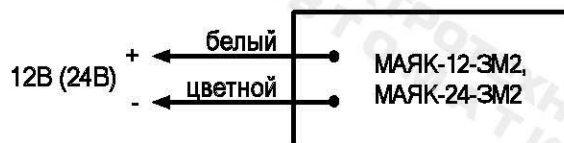
Рис.1. Схема подключения.